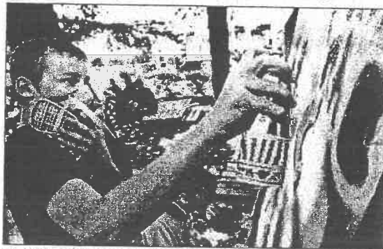
■ Un des jeunes artistes bagnolais s'entraîne à graffer.