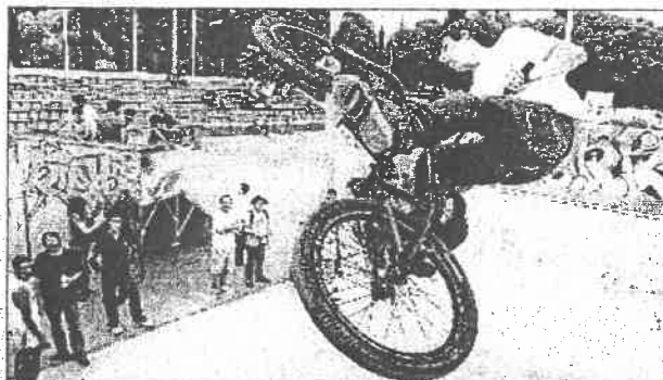
Parmi les animations de la journée, des démonstrations de BMX à l'espace Saint-Gilles.