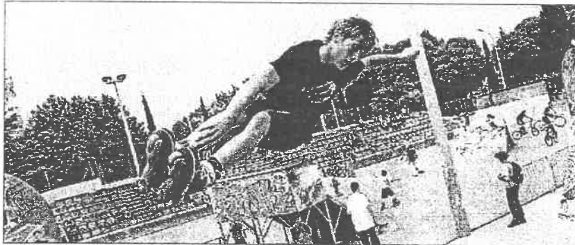
Roller, baignade, VTT, pêche, l'association Mosaïque en Cèze en a prévu pour tous les goûts !

Jeunesse | L'association Mosaïque en Cèze propose des activités et des chantiers aux adolescents, âgés entre 11 et 17 ans.