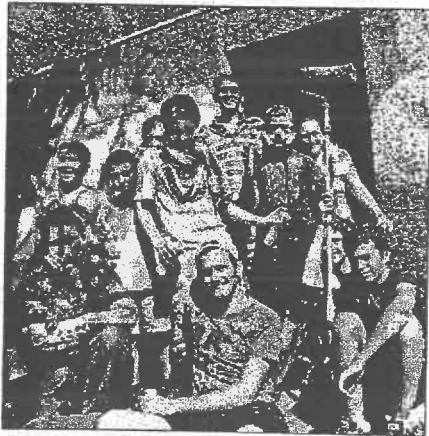
■ Autour de Pyrate devant la fresque pas encore terminée.