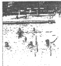
Des sorties piscine prévues.

Soirée projection du film "Hong Bak" à la Villa ; sortie Roller et baignade ; sortie plage, pêche et sortie vélo ; stage sport de combat et gestion des émotions (s'initier aux techniques des sports de combat, des arts martiaux, du karaté, de la self-défense et du yoga sportif).