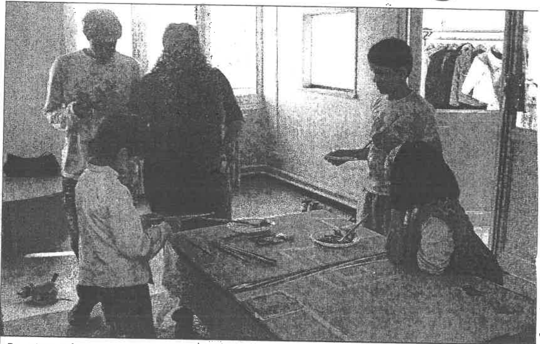
Parents et enfants ont participé à l'installation des lieux. Ici, ils construisent un tableau, qu'ils ont conçu.

Les personnes accueillies peuvent s'y rendre pour poser une question sur la parentalité, parler de leurs expériences, obtenir des informations sur toutes les structures qui peuvent être utiles aux parents. « Elles peuvent aussi venir juste pour y prendre un thé ou un café, poursuit la