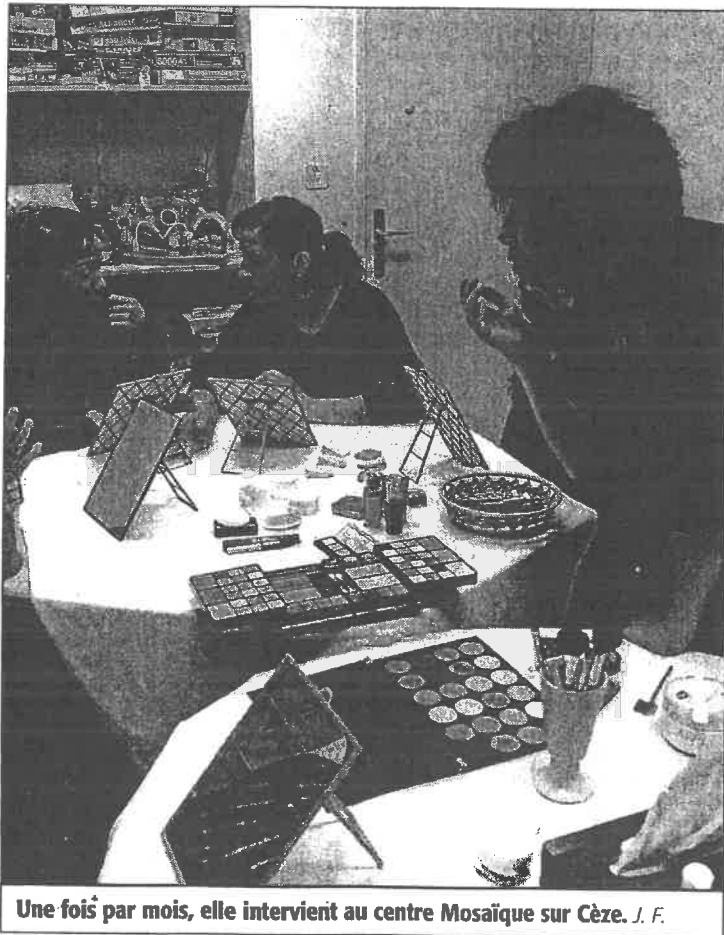
Une fois par mois, elle intervient au centre Mosaïque sur Cèze. J. F.

« Tout est parti de l'expression théâtrale et de ma rencontre avec l'association bagnolaise Sud Horizon », annonce la jeune femme. Produits de beauté, cotons, miroirs sont autant d'outils dont elle use pour redonner confiance aux femmes et aux hommes qu'elle croise sur son chemin. « Notre corps est unique. Qu'il soit meurtri par la vie, la maladie, le handicap, le temps, il a le droit au même bien-être », explique la socio-esthéticienne. L'objectif