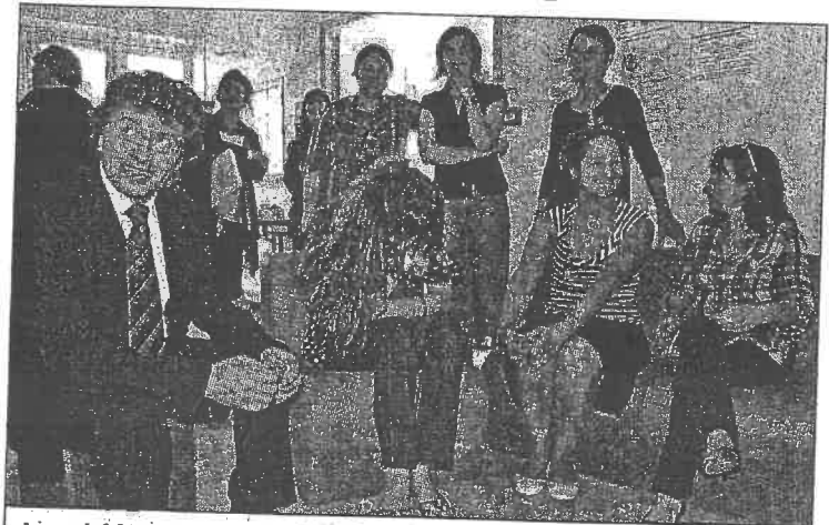
Le président du conseil général sur le terrain social à Bagnols.